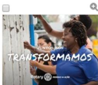
Juntos, nós transformamos: post para Facebook