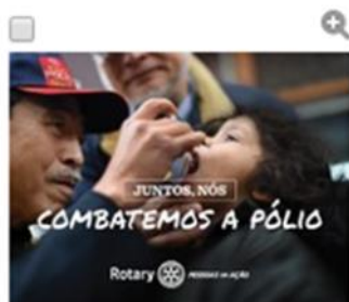
Juntos, nós combatemos a pólio: post para Facebook

A campanha PESSOAS EM AÇÃO facilita e aumenta a conscientização pública sobre o Rotary e o engajamento comunitário mostrando como a nossa organização faz acontecer. Clique aqui para conhecer os materiais.