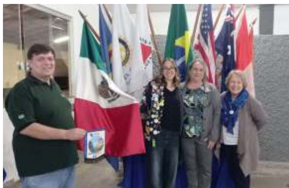
19/08: Visita ao Rotary Club de Três Corações. “Pauta enriquecedora, com destaque ao Intercâmbio e Jovens.”