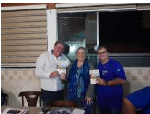
06/08 - Visita ao Rotary Club de Três Pontas. Foi uma noite feliz! Obrigada pela gentil recepção e parabéns ao clube pelo trabalho que realiza.”