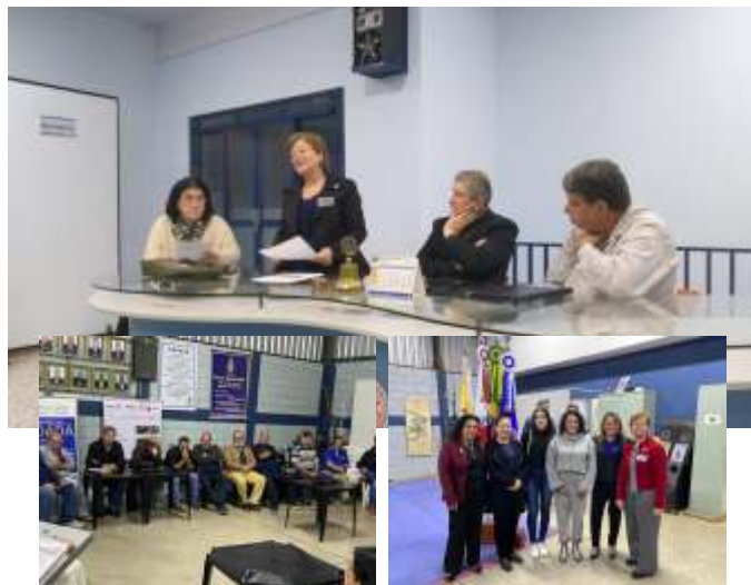
GA Rosa Pouso Alegre Sul