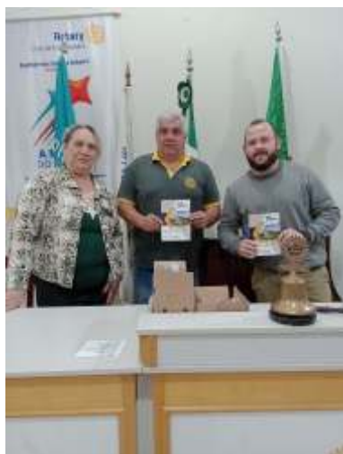
14/08: Visita ao Rotary Club de Elói Mendes. “Uma reunião especial de homenagem aos pais que integram o Quadro Associativo do clube, com direito a um super churrasco.”