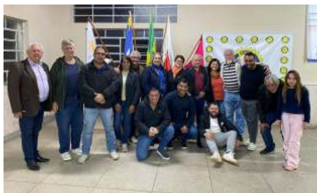
12/08: Visita ao Rotary Club de Varginha. “Noite agradável, com muito companheirismo”