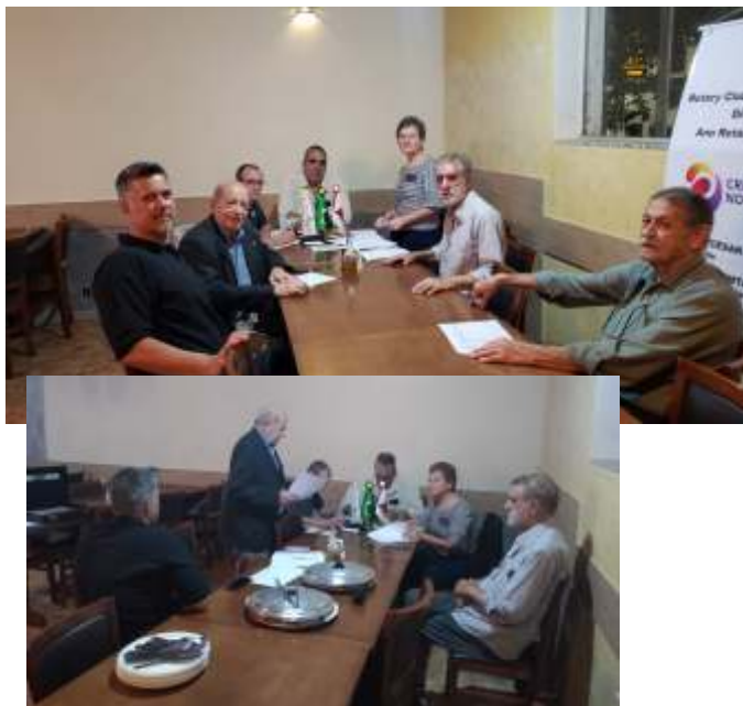
GA Rosa Itajubá 19 de Março