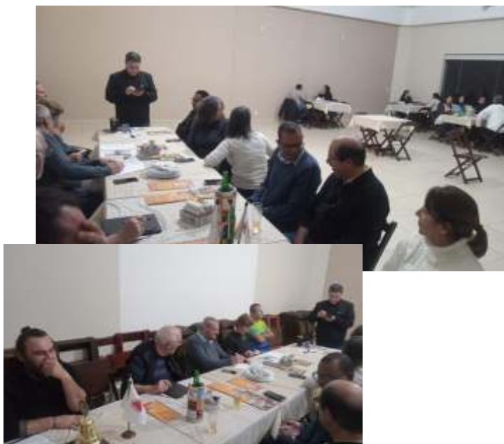
GA Rosa em Monte Sião