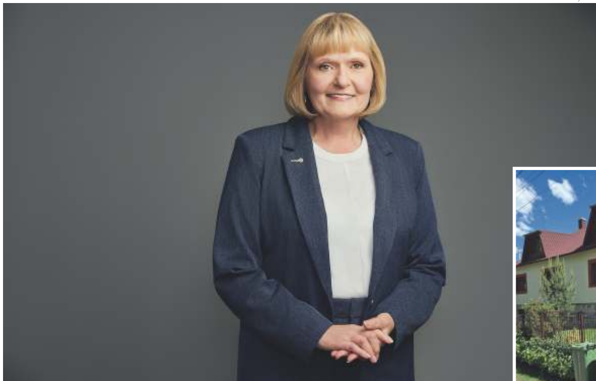
Casa da avó de Urchick na Eslováquia